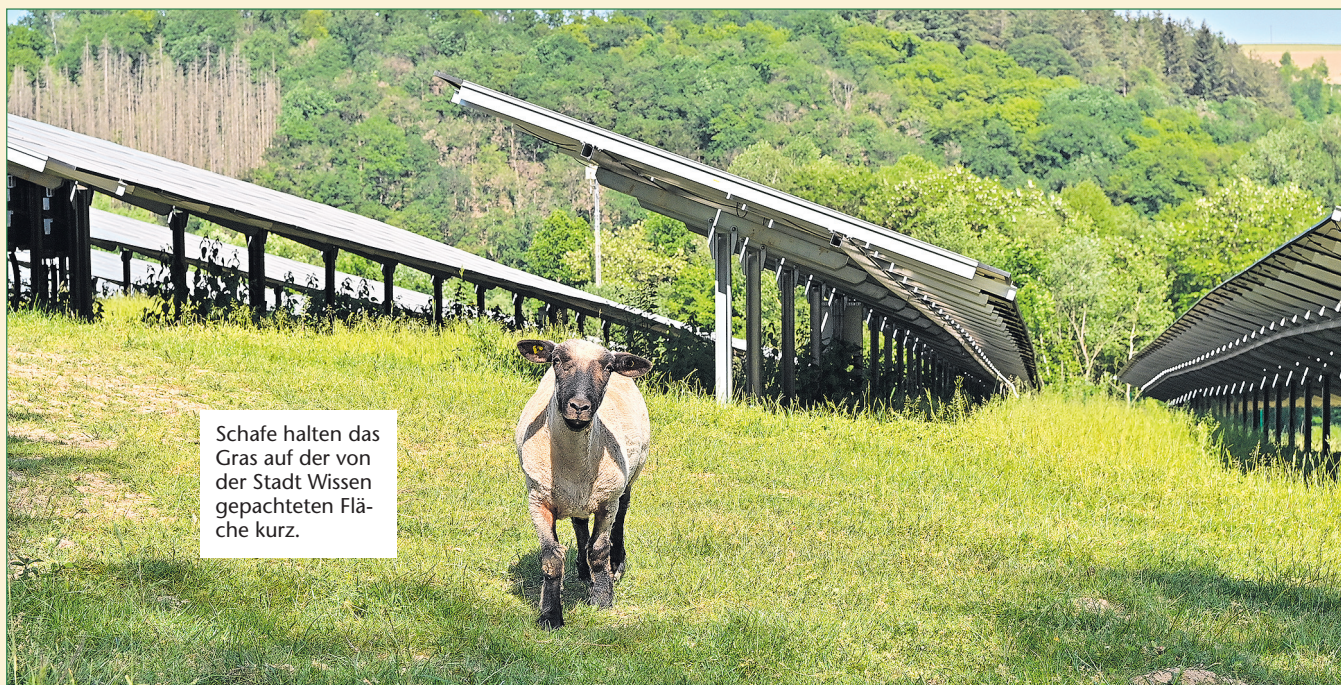
Schafe halten das Gras auf der von der Stadt Wissen gepachteten Fläche kurz.

Unterhalb der Böschung, über der die Photovoltaik-Module des „Solarparks Bornscheidt“ gerade tausendfach in der Sommersonne blitzen, donnert ein Zug auf der