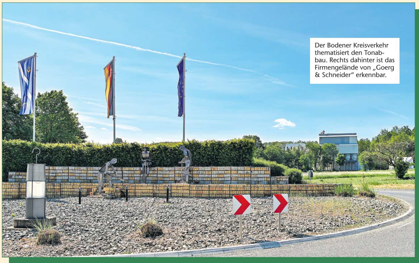
Der Bodener Kreisverkehr thematisiert den Tonabbau. Rechts dahinter ist das Firmengelände von „Goerg & Schneider“ erkennbar.

Gas wie Strom benötigt ein circa 85 Meter langer Tunnelofen, in dem Schamotte bei über 1.200 Grad Celsius gebrannt wird. Er ist Hauptenergieverbraucher in Boden, läuft an 365 Tagen im Jahr. Denn es dauere alleine zehn Tage, diesen Ofen anzustellen. Und schneller sei er auch nicht abzukühlen, höchstens 100 Grad am