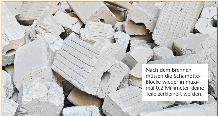
Nach dem Brennen müssen die Schamotte-Blöcke wieder in maximal 0,2 Millimeter kleine Teile zerkleinert werden.

Rund 95 Mitarbeiter sind bei „Goerg & Schneider“ fleißig, größter Betriebsteil ist Boden. Hier werden auch 80 Prozent der gesamten Energie des Unternehmens verbraucht.