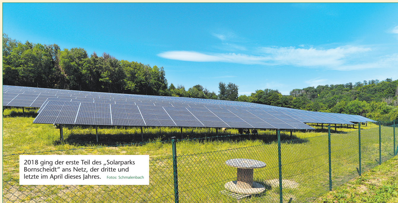
2018 ging der erste Teil des „Solarparks Bornscheidt“ ans Netz, der dritte und letzte im April dieses Jahres.